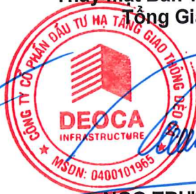
NGỘ TRƯỜNG NAM