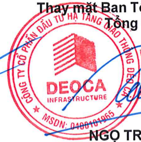
NGỘ TRƯỜNG NAM